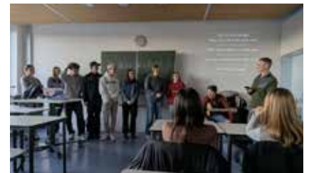
Einsatz am Gymnasium

Gymnasium Trossingen gestaltet. Dabei haben sie die Schüler und Schülerinnen mit spannenden Themen und Zeugnissen aus ihrem Leben, sowie lockeren Gesprächen begeistert. Darüber hinaus haben sie am Nachmittag ein buntes Programm bei einer unserer Jungscharen und der Sportjungchar so geleitet, dass die Kinder und Jugendlichen voll bei der Sache waren.