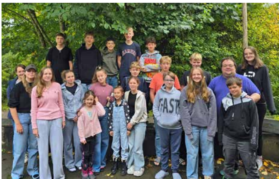
Gruppenfoto der aktuellen Konfis, aufgenommen am Ende der gelungenen Konfifreizeit.