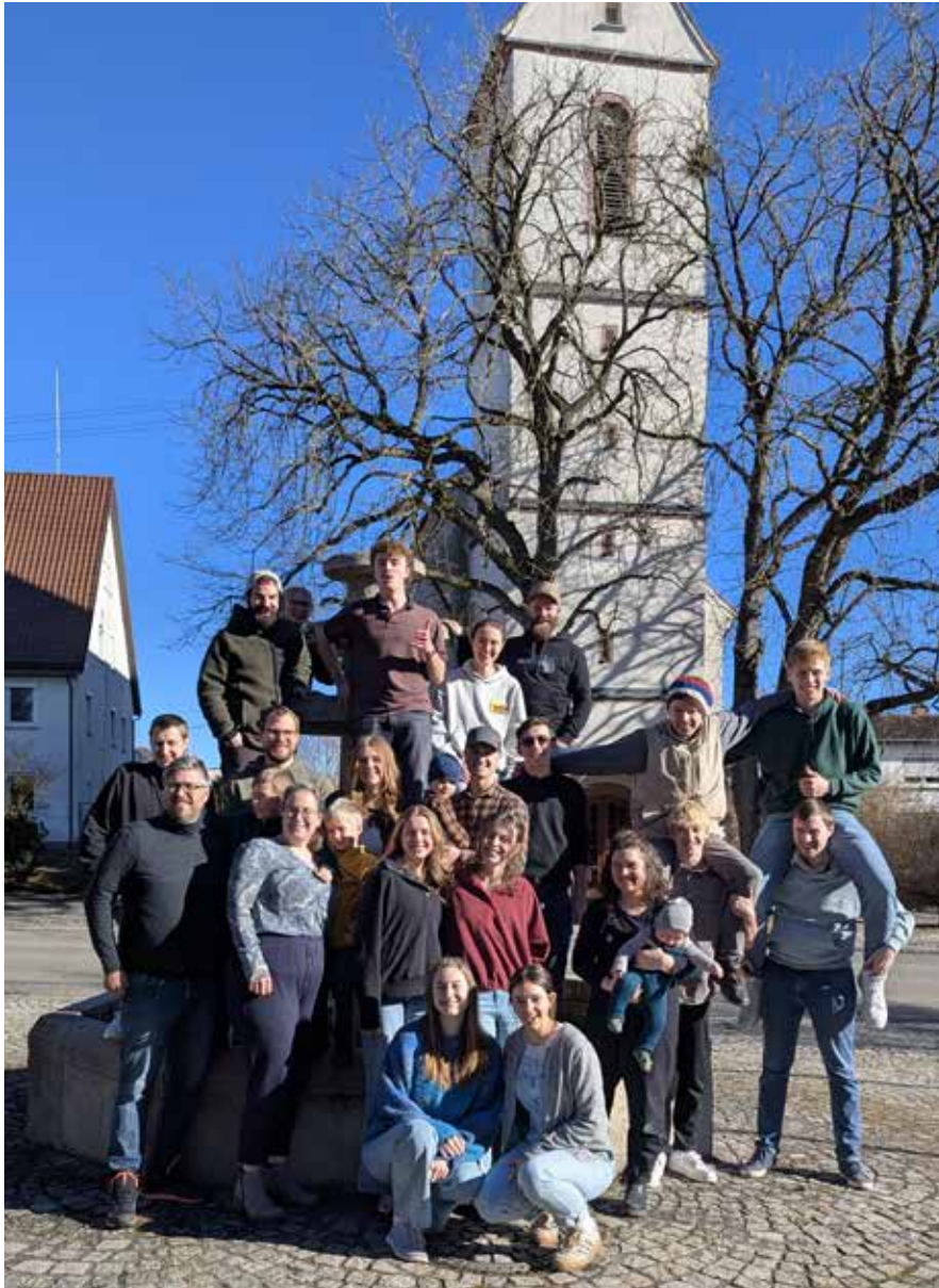
Bodenseehof-Gruppe mit Helfer

Internationale Studierende von der Bibelschule des Bodenseehof waren in unserer Gemeinde aktiv