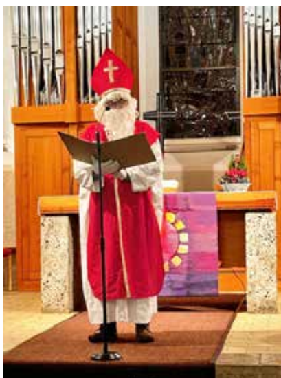
Besuch von Bischof Nikolaus beim Schuremer Advent

An drei Freitagen vor den Adventssonntagen konnten die Besucher unterschiedliche Personen oder Traditionen der Adventszeit erleben.